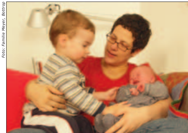
Kontaktaufnahme zwischen den Geschwistern – das frühgeborene Kind wächst in die Familie hinein

Für frühgeborene Kinder und Ihre Eltern ist die Anpassung an jede neue Stufe womöglich schwieriger und braucht länger als bei reifgeborenen Kindern und ihren Eltern. Wir haben bereits beschrieben, dass die Kinder seltener in einem Zustand wacher, „spielbereiter“ Aufmerksamkeit und rascher von Anregungen und Informationen überfordert sind. Sie zeigen weniger klare Signale, wann und wie viel Interaktionsangebote sie aufnehmen können, z. T. sind sie öfter quengelig und haben Ess- und Schlafprobleme.