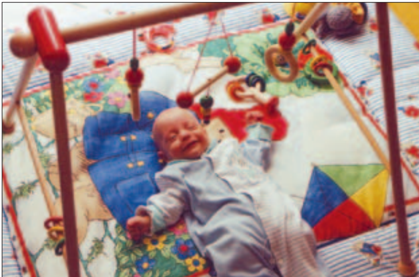
Bunte Mobiles wecken die Aufmerksamkeit und regen zum Greifen an.

Es ist sehr wichtig, dass die Eltern die ersten Zeichen von physiologischem Stress und Überforderung erkennen und die Stimulation entsprechend vermindern, bevor das Baby vollends sein Gleichgewicht verliert. Dass das Kind eine Pause braucht, lässt sich feststellen an schneller und unregelmäßiger Atmung, veränderter